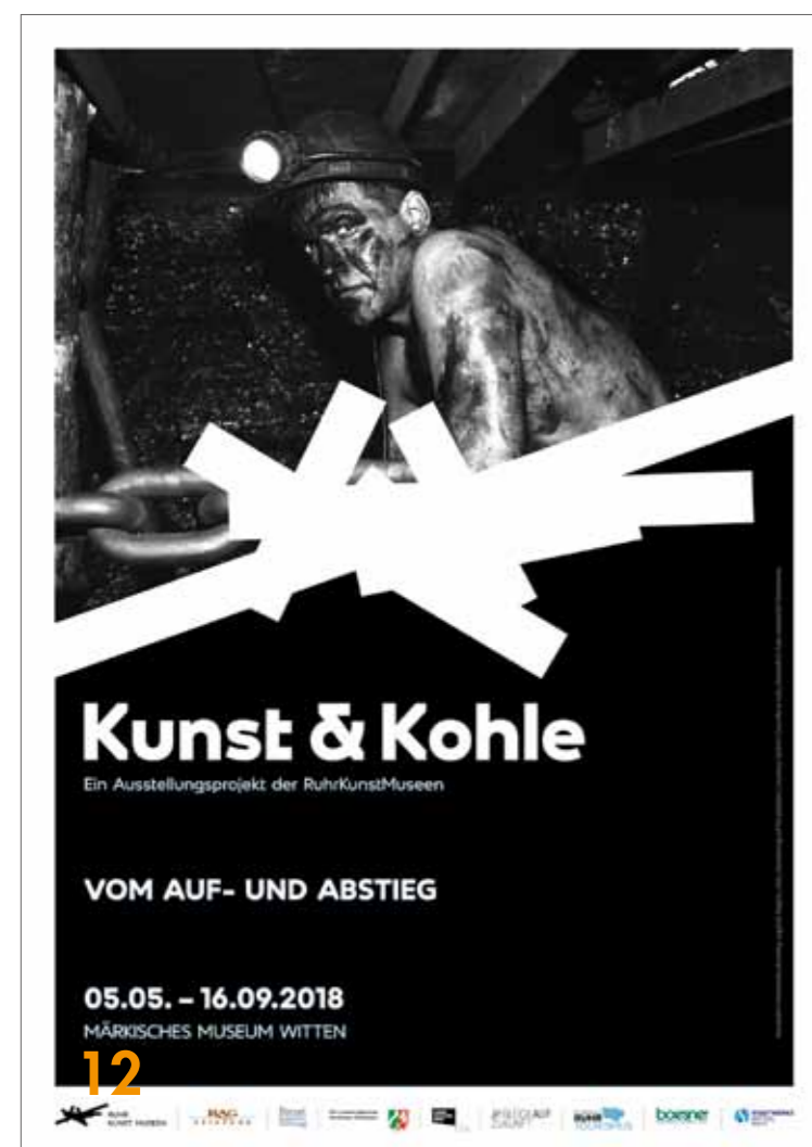
17 Kunstmuseen beteiligen sich an dem Ausstellungsprojekt

12 SCHICHTWECHSEL IM RUHRGEBIET: Kohleausstieg wird mit der umfangreichen Ausstellung „Kunst & Kohle“ der RuhrKunstMuseen begleitet. Die Vermarktung liegt bei der Ruhr Tourismus GmbH